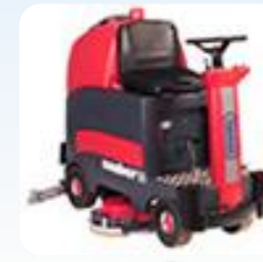
Поломоечная машина Cleanfix RA 900