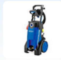
Аппарат высокого давления Nilfisk MC 4M