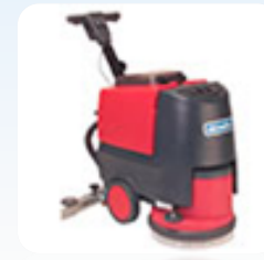
Поломоечная машина Cleanfix RA 431 RE